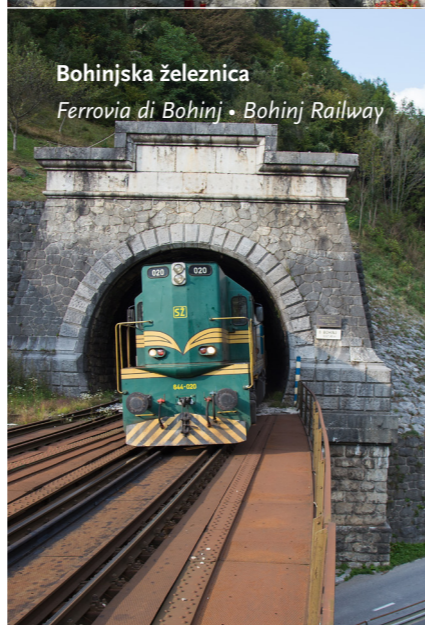
Bohinjska železnica Ferrovia di Bohinj • Bohinj Railway