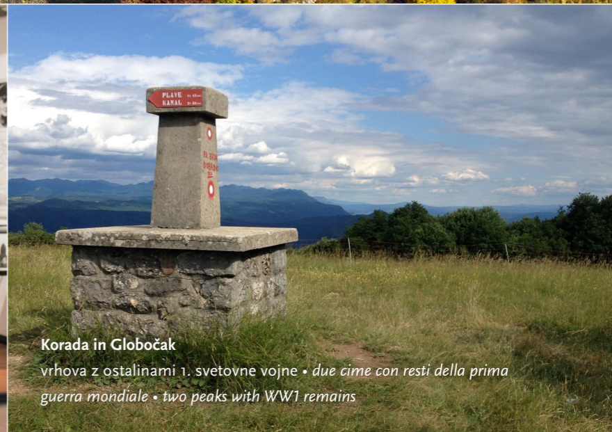
Korada in Globočak vrhova z ostalinami 1. svetovne vojne • due cime con resti della prima guerra mondiale • two peaks with WW1 remains