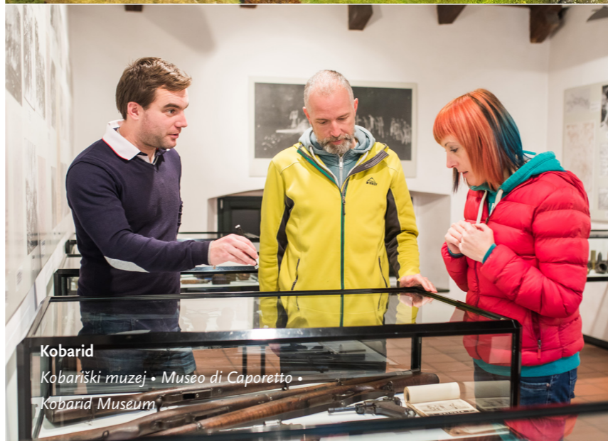
Kobarid Kobariški muzej • Museo di Caporetto • Kobarid Museum