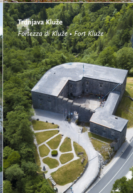
Trdnjava Kluže Fortezza di Kluže • Fort Kluže