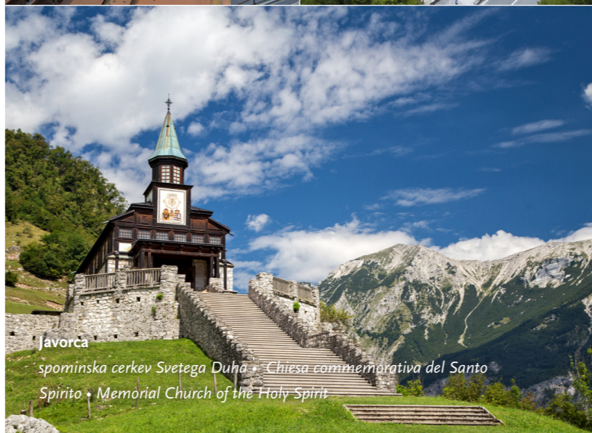
Javorca spominska cerkev Svetega Duha • Chiesa commemorativa del Santo Spirito • Memorial Church of the Holy Spirit