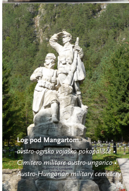
Log pod Mangartom avstro-ogrsko vojaško pokopališče • Cimitero militare austro-ungarico • Austro-Hungarian military cemetery