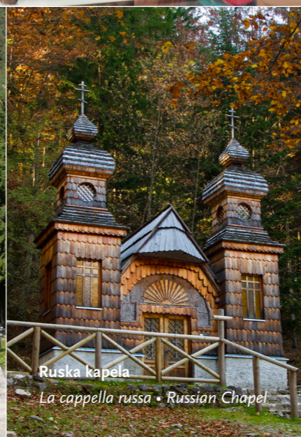
Ruska kapela La cappella russa • Russian Chapel